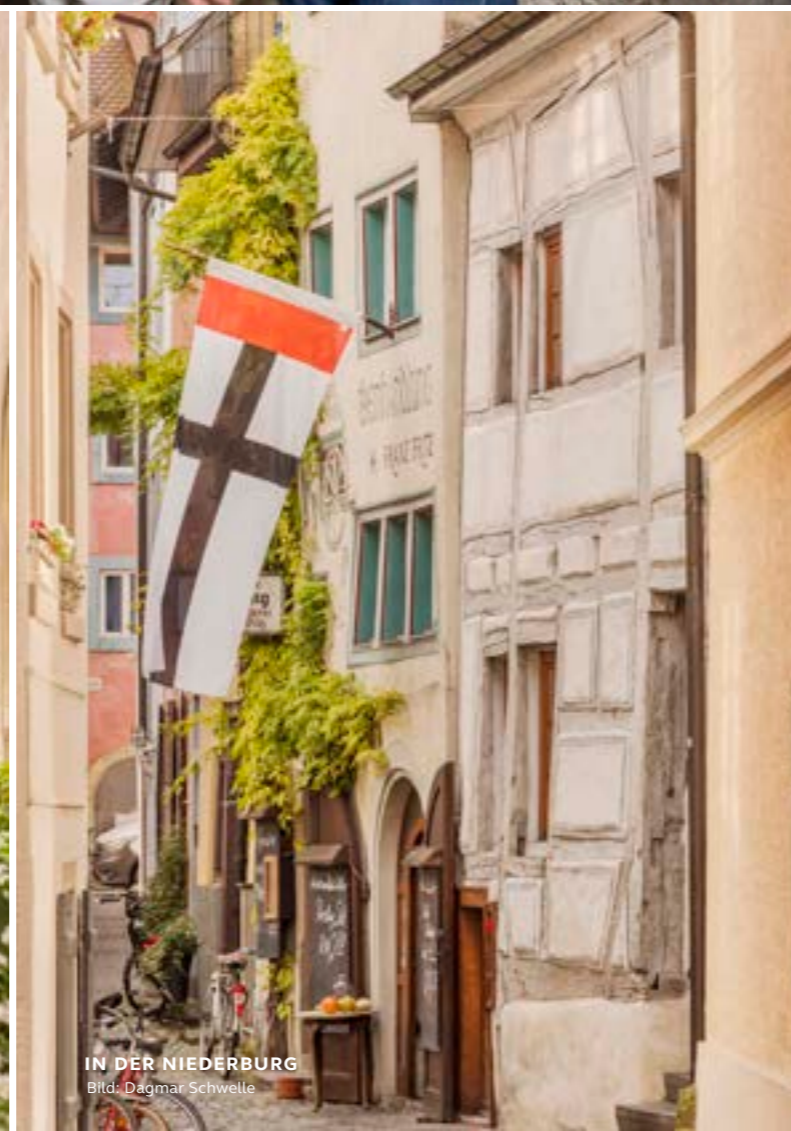
IN DER NIEDERBURG