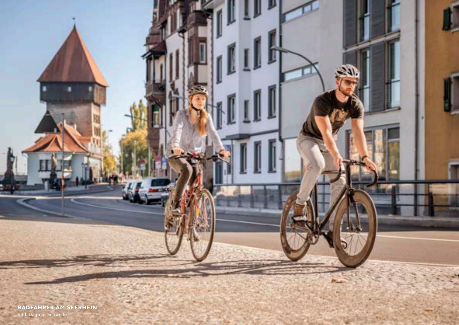
RADFAHRER AM SEERHEIN