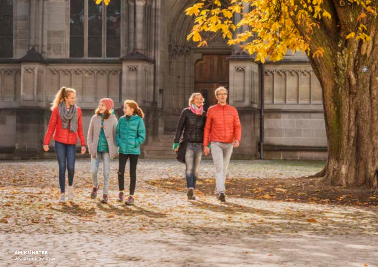
AM MÜNSTER