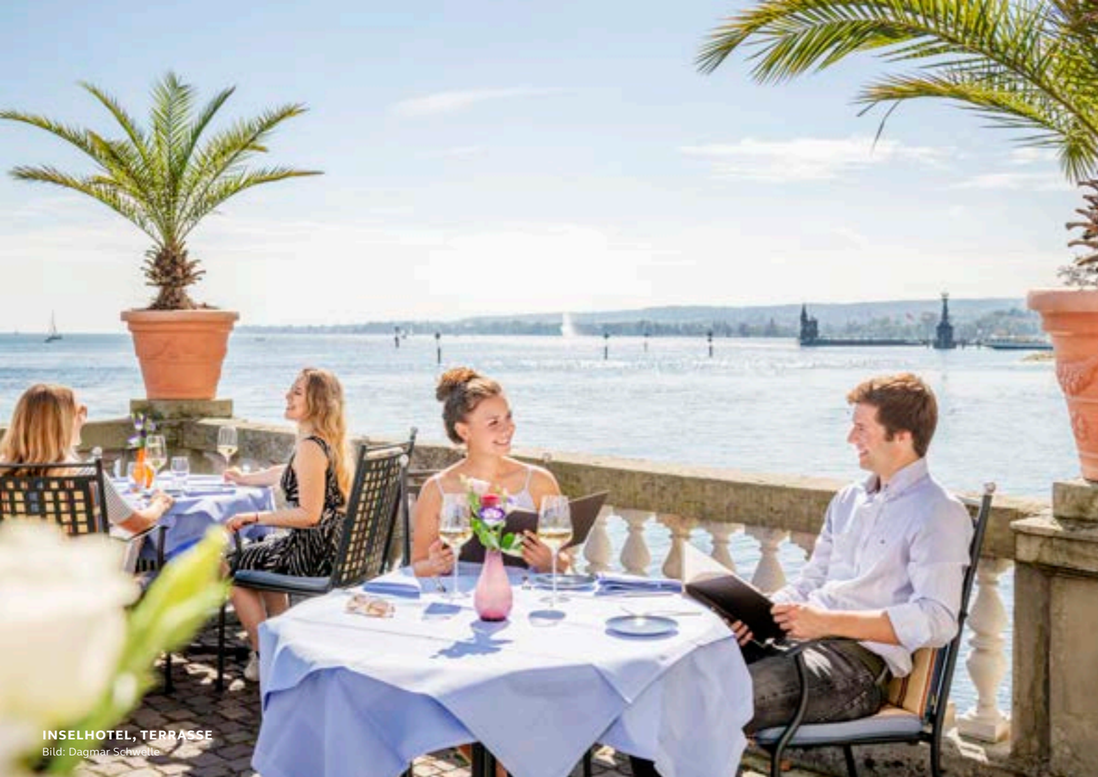
INSELHOTEL, TERRASSE