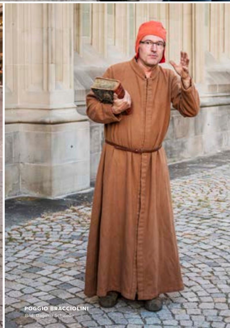
POGGIO BRACCIOLINI