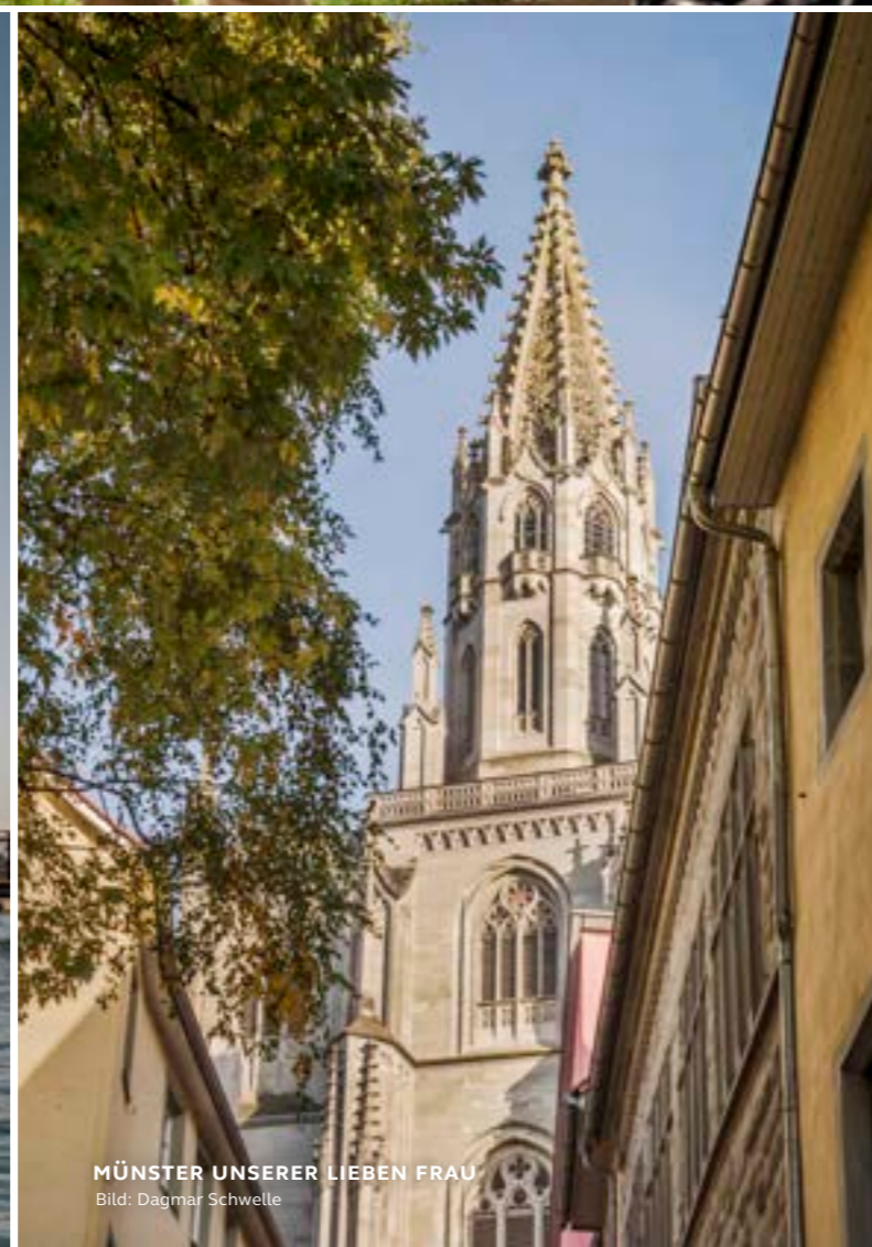
MÜNSTER UNSERER LIEBEN FRAU