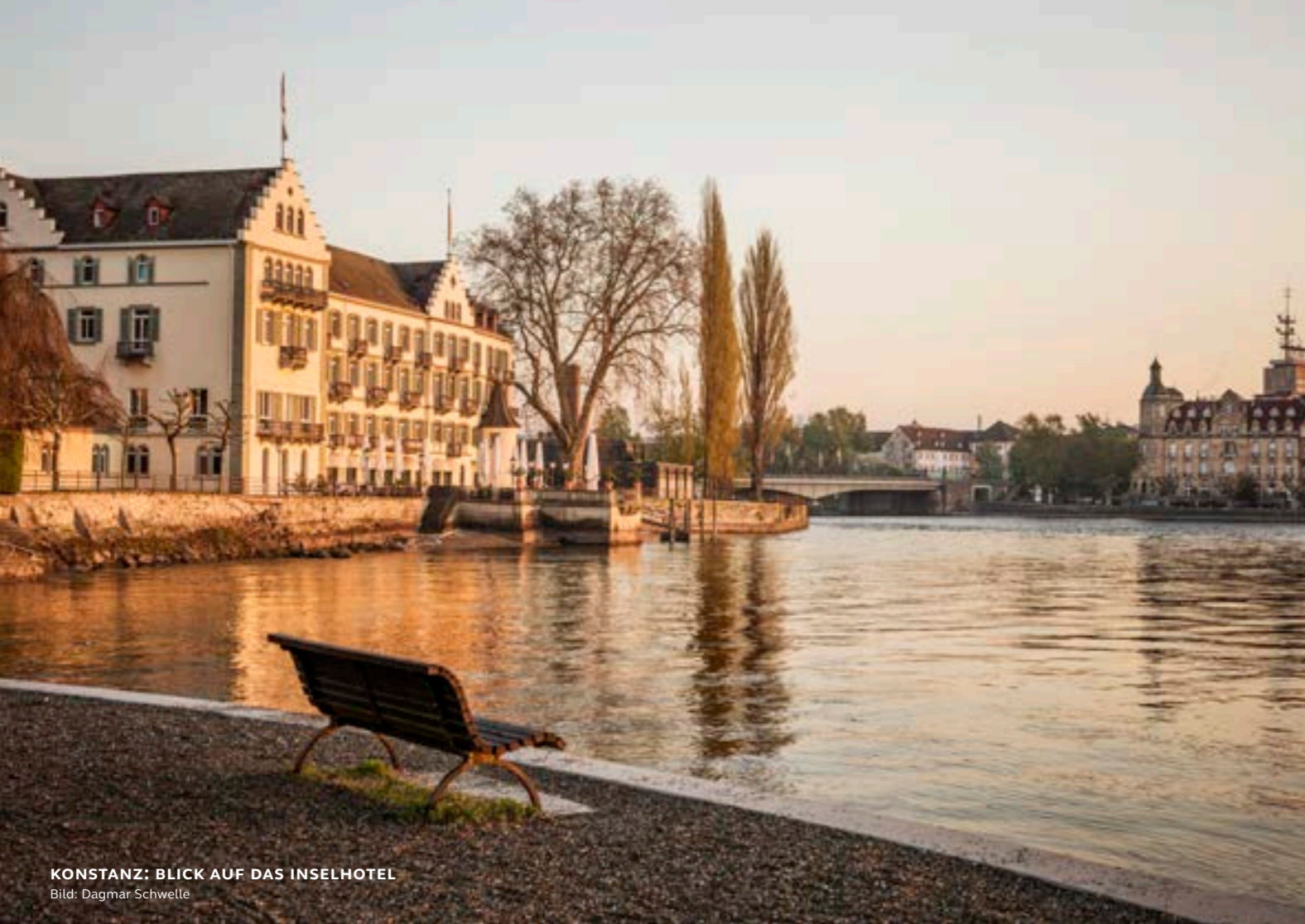
KONSTANZ: BLICK AUF DAS INSELHOTEL