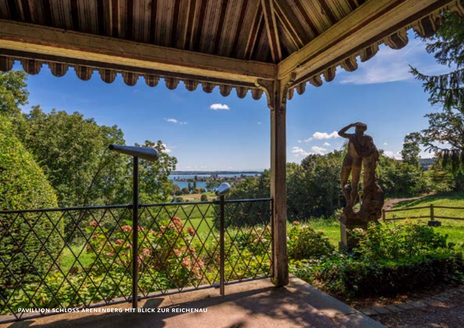
PAVILLION SCHLOSS ARENENBERG MIT BLICK ZUR REICHENAU