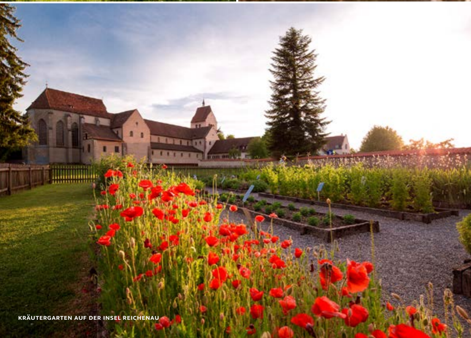
KRÄUTERGARTEN AUF DER INSEL REICHENAU