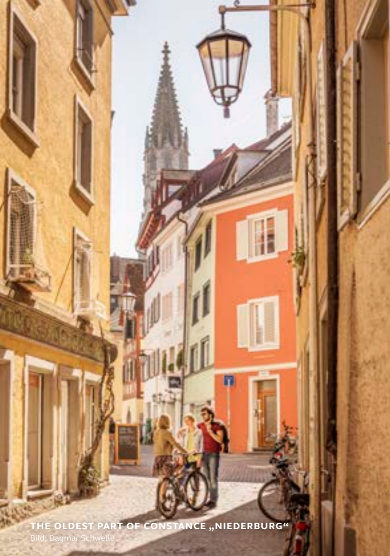
THE OLDEST PART OF CONSTANCE „NIEDERBURG“