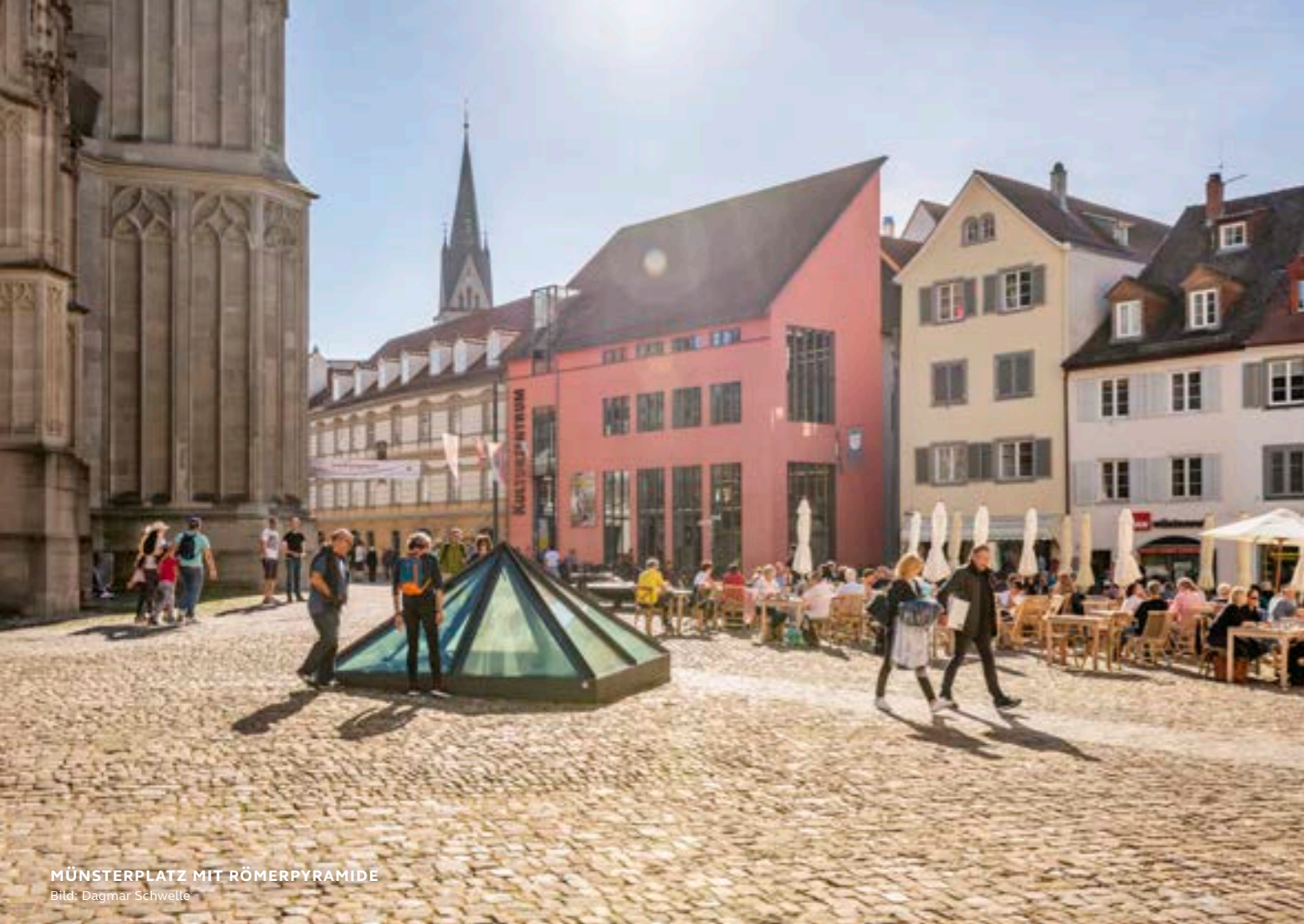
MÜNSTERPLATZ MIT RÖMERPYRAMIDE