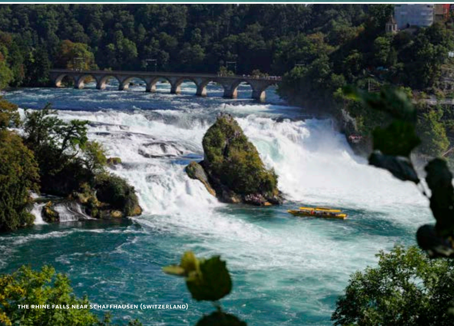
THE RHINE FALLS NEAR SCHAFFHAUSEN (SWITZERLAND)

This tour can be combined with a tour of Meersburg or a tour of Constance.