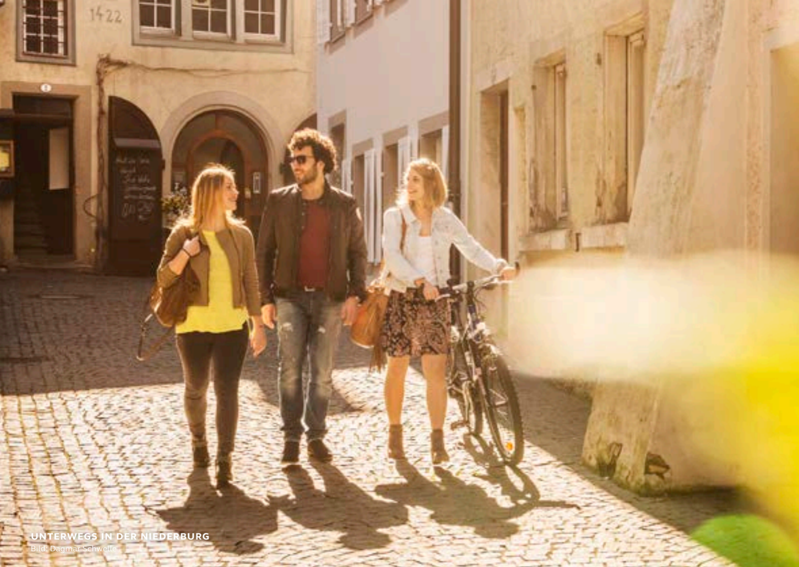
UNTERWEGS IN DER NIEDERBURG