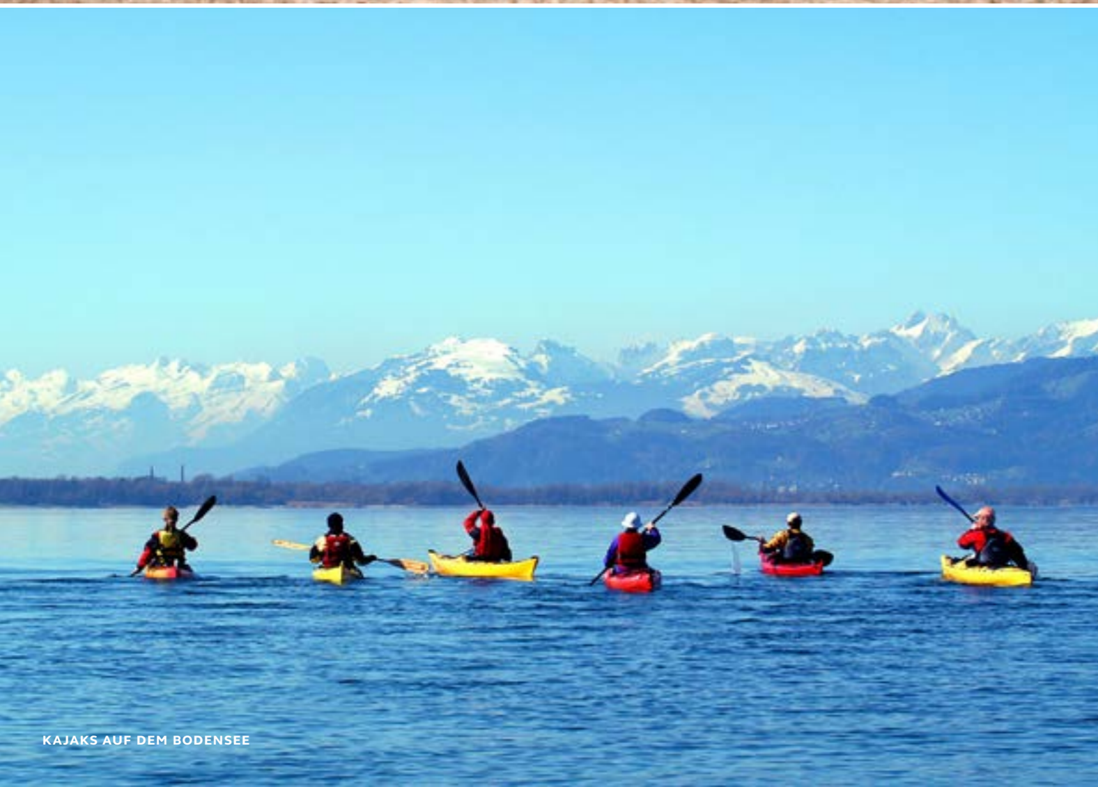
KAJAKS AUF DEM BODENSEE