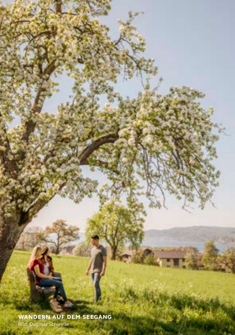
WANDERN AUF DEM SEEGANG