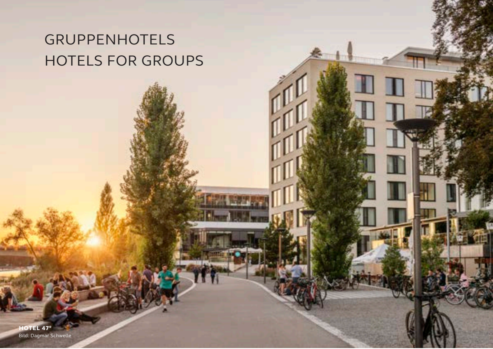
HOTEL 47°