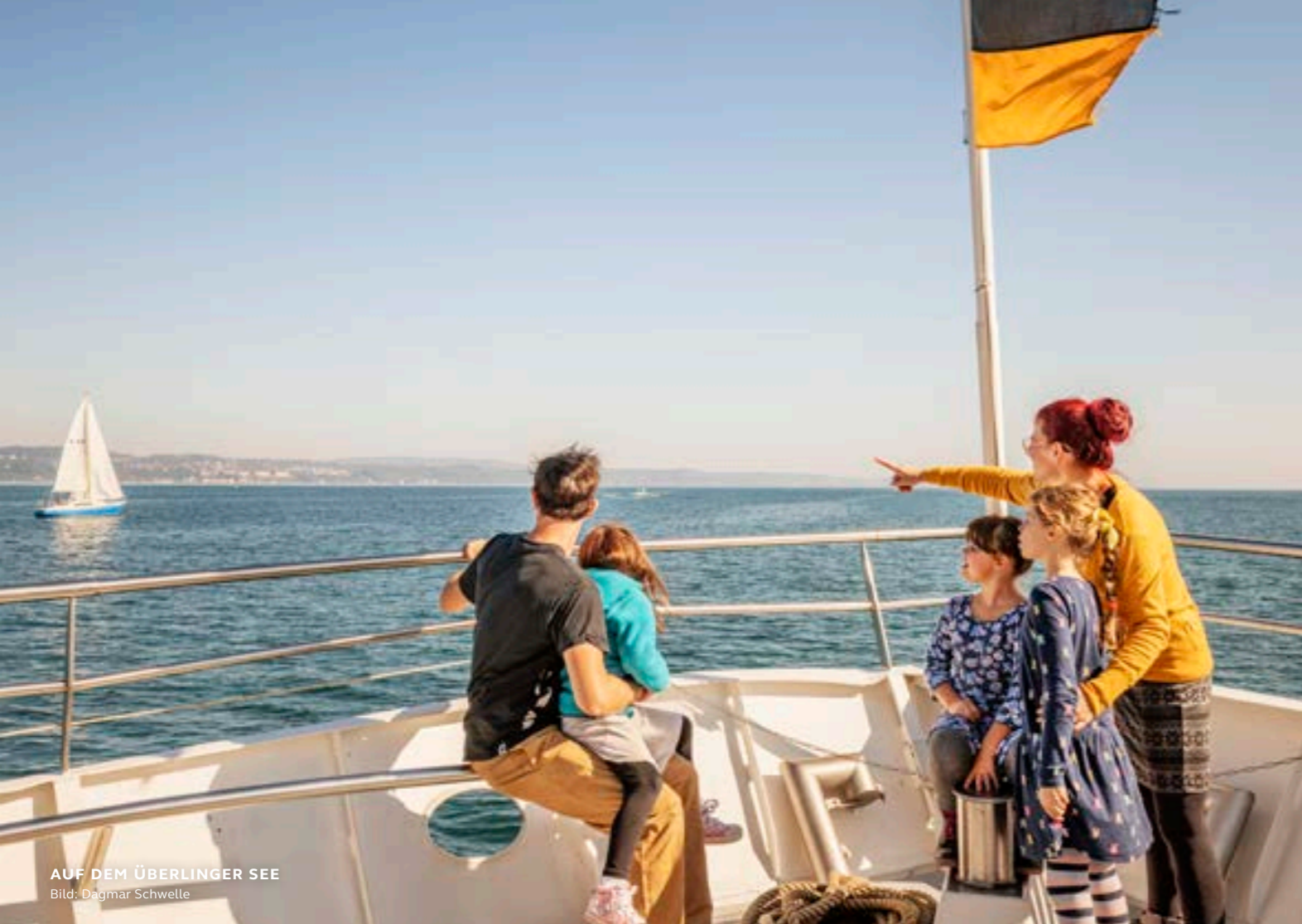
AUF DEM ÜBERLINGER SEE