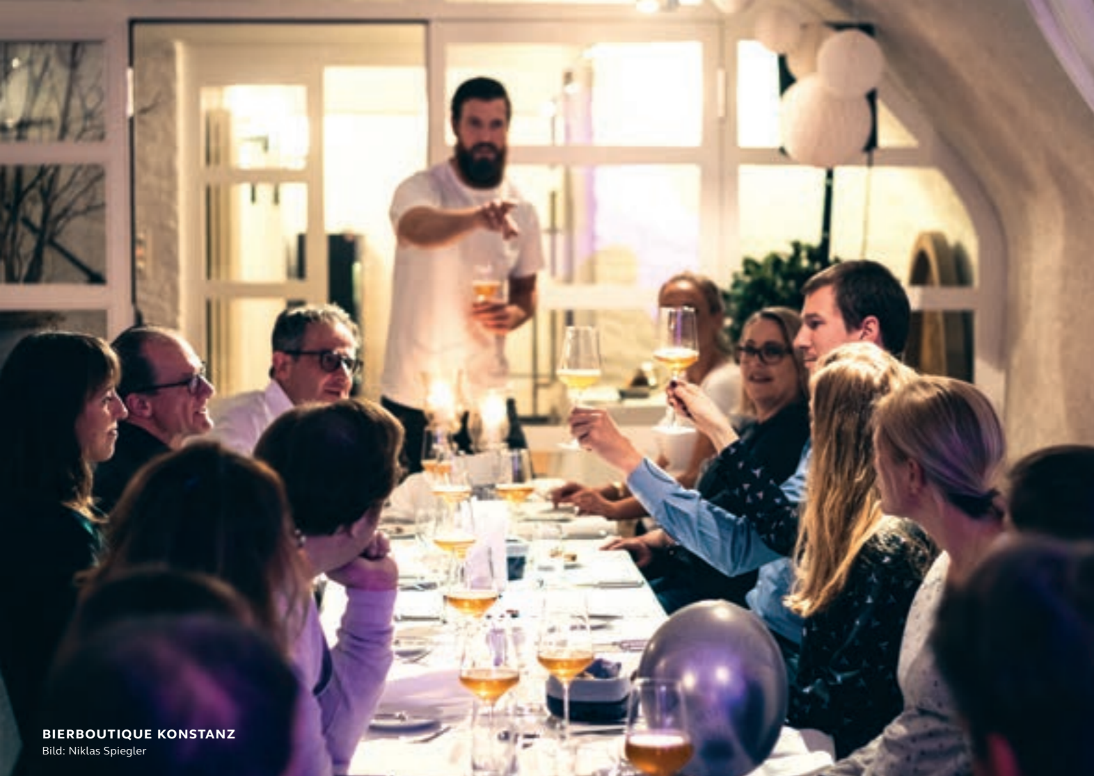
BIERBOUTIQUE KONSTANZ