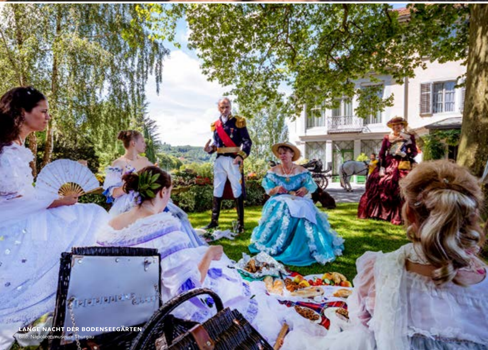
LANGE NACHT DER BODENSEEGÄRTEN

Dieses Programm lässt sich außerdem sehr gut mit einem Ausflug zum Rheinfall bei Schaffhausen und nach Stein am Rhein kombinieren (S. 43).