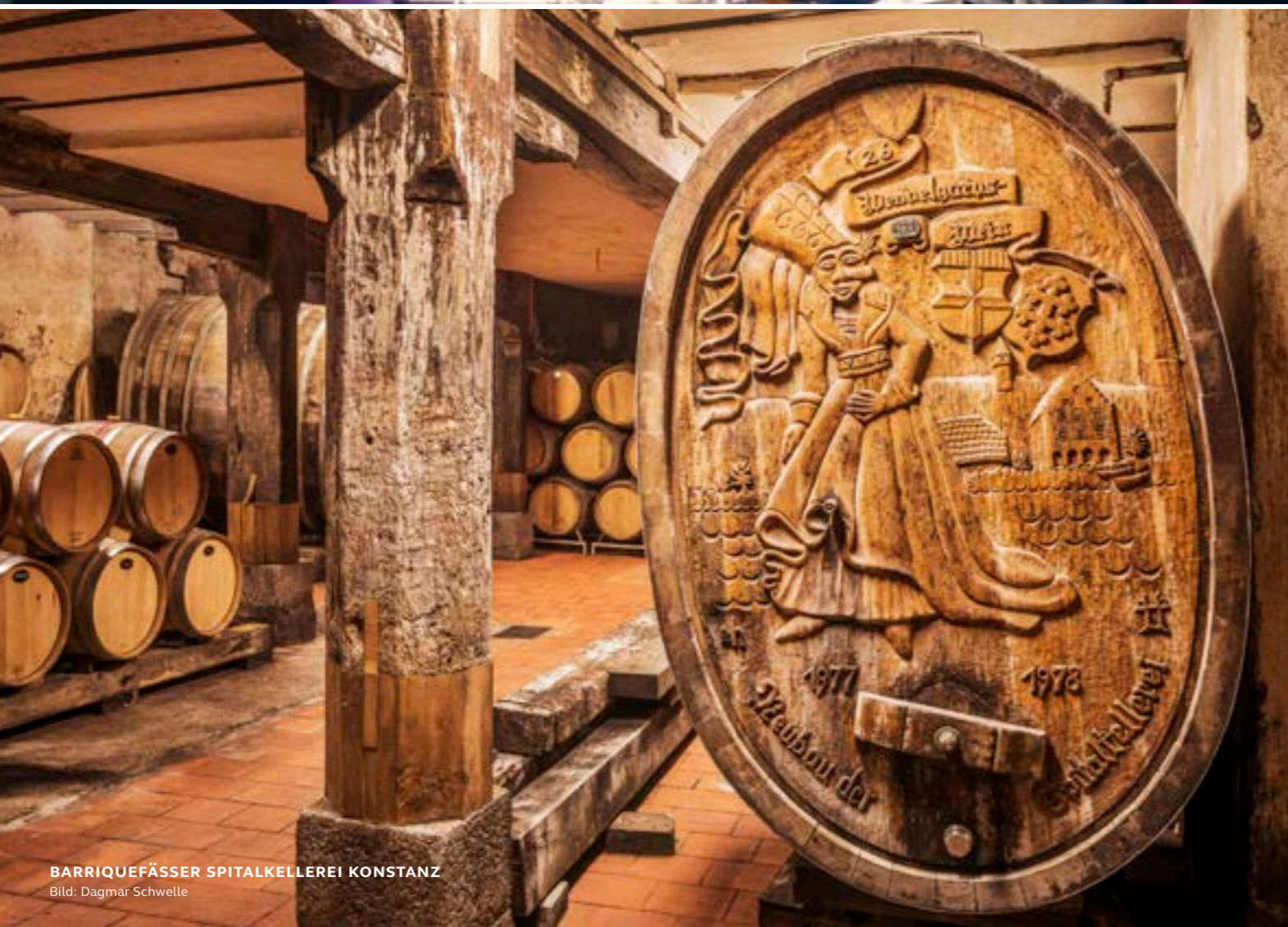
BARRIQUEFÄSSER SPITALKELLEREI KONSTANZ