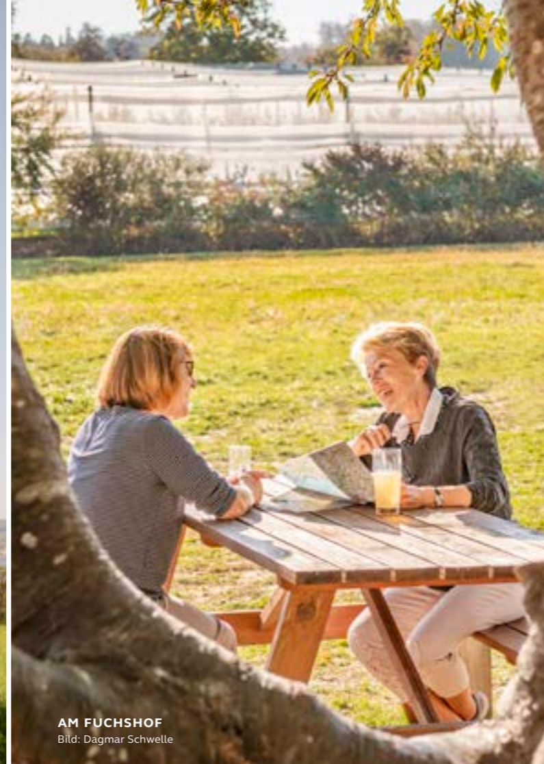
AM FUCHSHOF