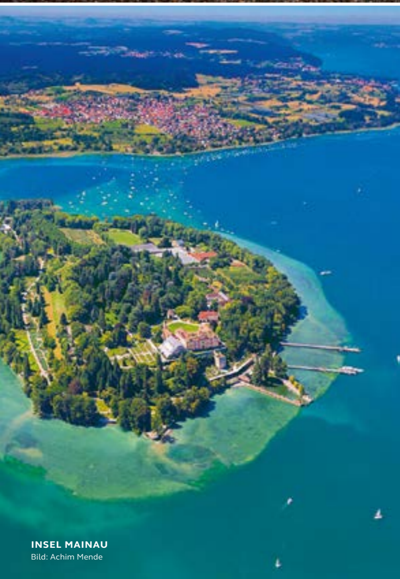
INSEL MAINAU