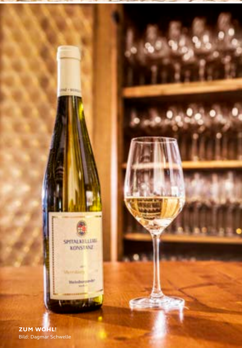
ZUM WOHL!