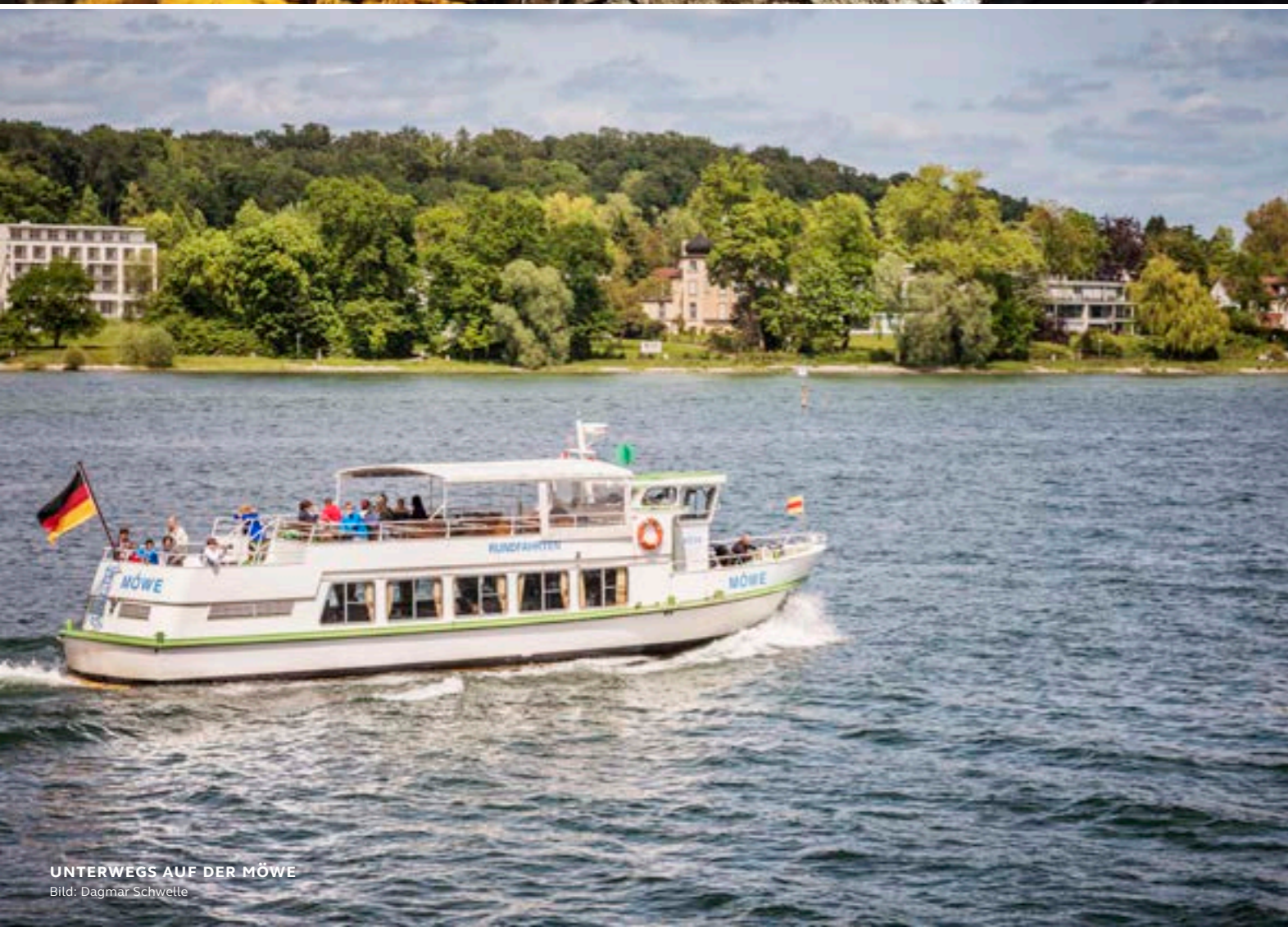
UNTERWEGS AUF DER MÖWE