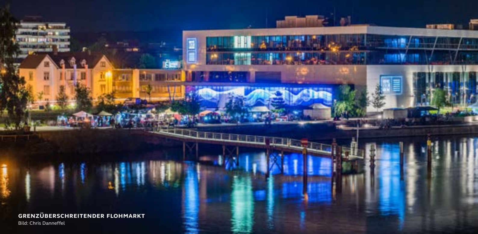
GRENZÜBERSCHREITENDER FLOHMARKT