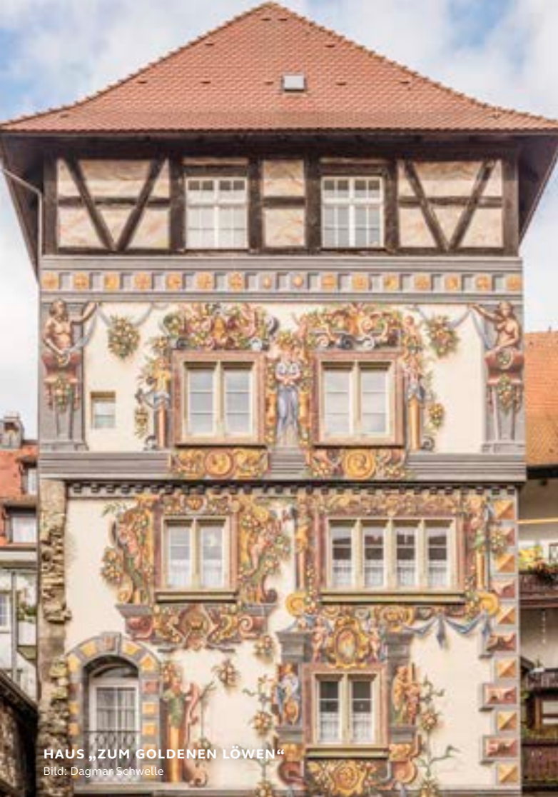
HAUS „ZUM GOLDENEN LÖWEN“