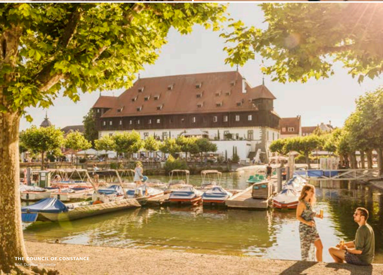
THE COUNCIL OF CONSTANCE