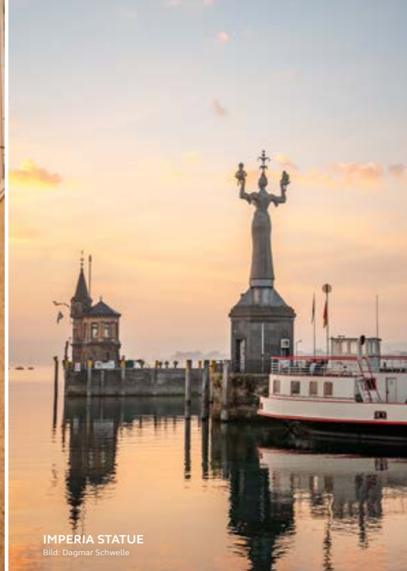
IMPERIA STATUE