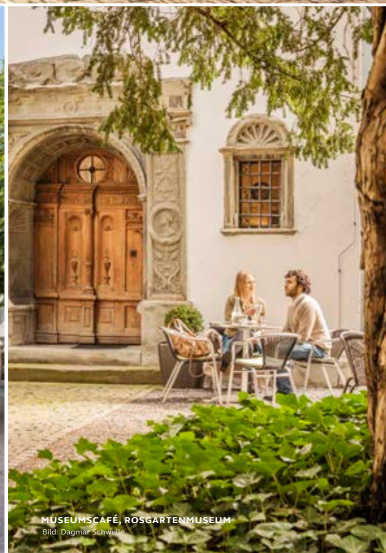
MUSEUMSCAFÉ, ROSGARTENMUSEUM