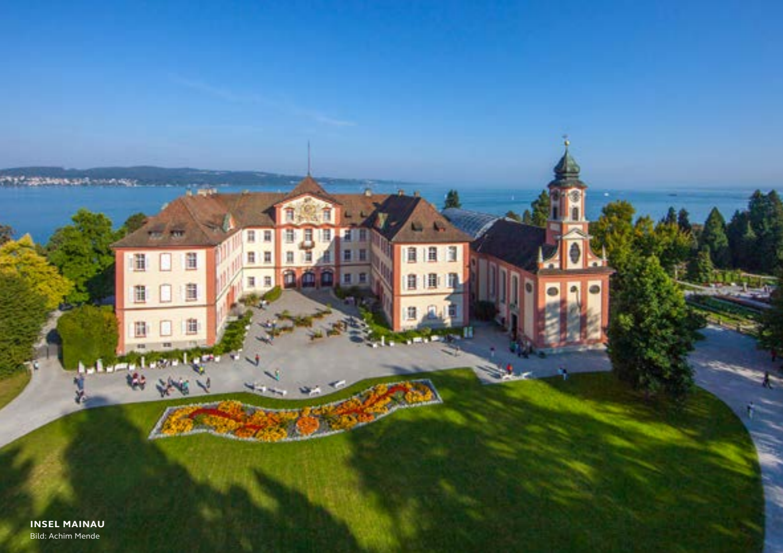
INSEL MAINAU