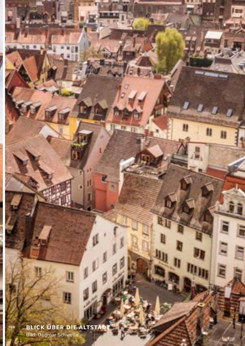
BLICK ÜBER DIE ALTSTADT