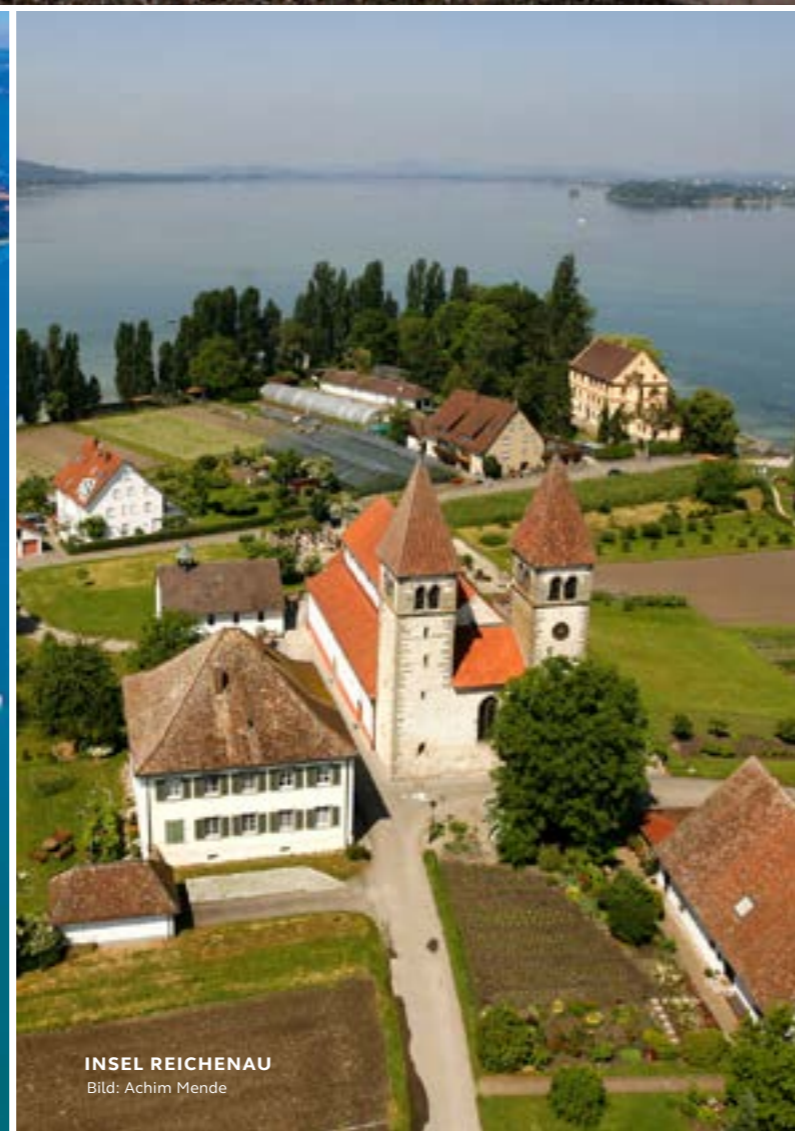
INSEL REICHENAU