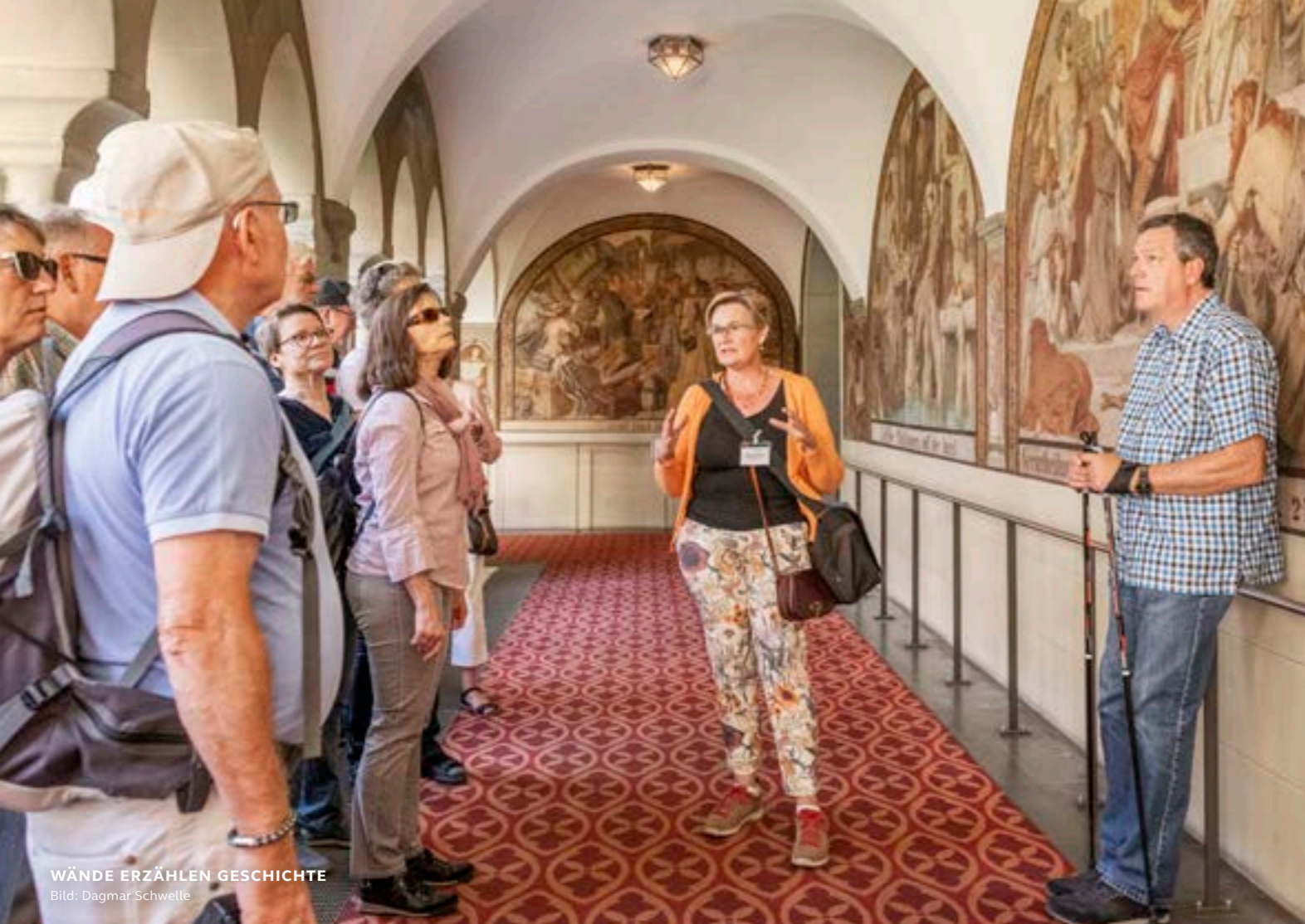
WÄNDE ERZÄHLEN GESCHICHTE