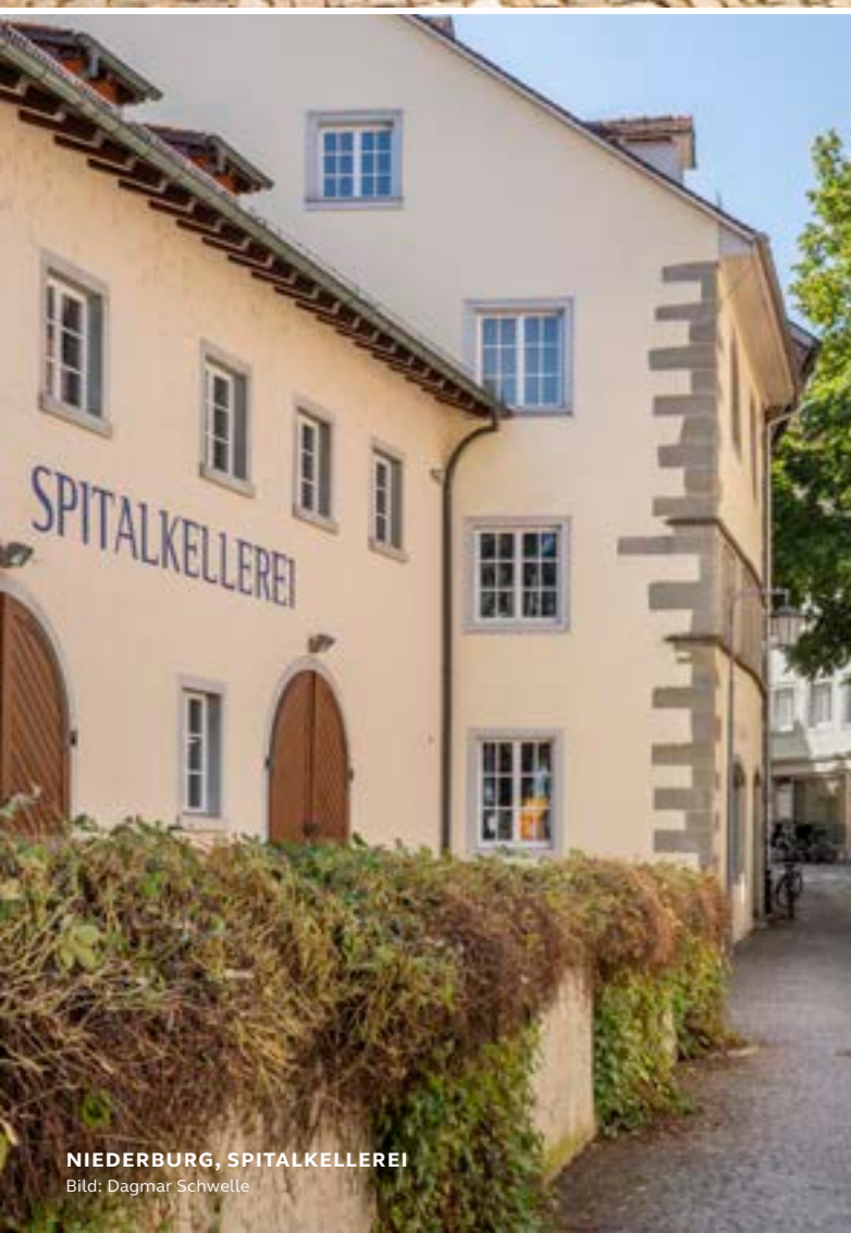
NIEDERBURG, SPITALKELLEREI